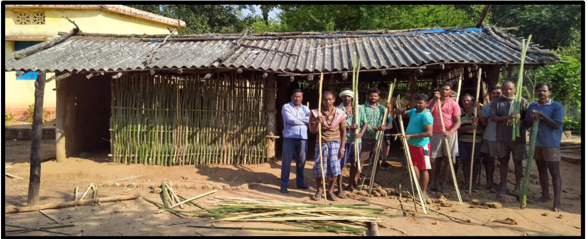
( लोकसहभागातून वर्गखोली बांधकाम )

शाळा विकासात शिक्षक पालक संघ / शालेय व्यवस्थापन समिती/ पालक सहभाग यातून विद्यार्थी व शाळा विकासात झालेले बदल :- पालकांच्या शिक्षणामुळे जिल्हा परिषद प्राथमिक शाळा जाजावंडी या शाळेत विद्यार्थी संख्या झपाट्याने वाढत गेल्यामुळे या शाळेत वर्ग पाचवी सहावी व सातवी जोडण्यात आले मात्र जिल्हा परिषद प्राथमिक शाळा जाजावंडी या शाळेत वर्ग खोल्या मात्र दोनच होत्या. शाळा व्यवस्थापन समिती व गावातील नागरिकांनी मिळून शाळेसाठी दोन वर्गखोल्यांचे बांधकाम करून दिले व वेळोवेळी शाळेसाठी शिक्षक पालक संघ/ शालेय व्यवस्थापन समितीचा सक्रीय सहभाग प्राप्त झाला.