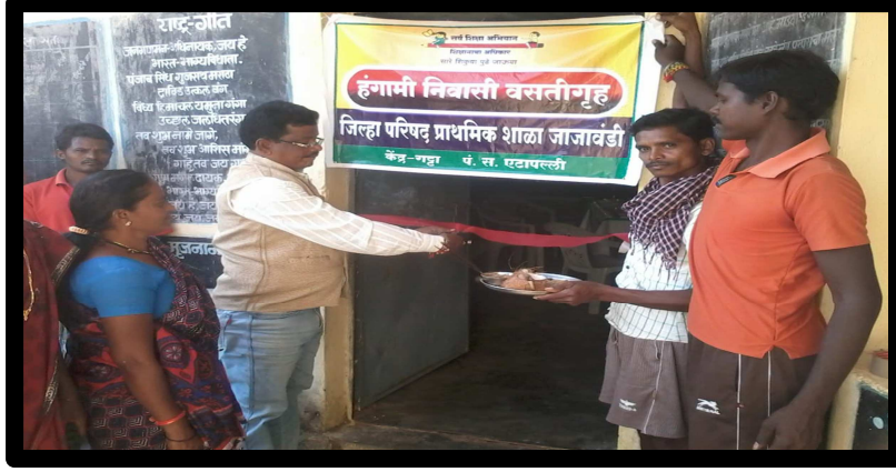
( हंगामी वसतिगृहाचे उद्घाटन करताना केंद्रप्रमुख )

5) हंगामी वसतिगृह योजना:- शाळा आदिवासी बहुल अतिदुर्गम नक्षलग्रस्त क्षेत्रात येत असल्याने या भागातील बरेच विद्यार्थी शाळाबाह्य होतात, सर्वेक्षणानंतर असे लक्षात आले की गावातील पालक बाहेरगावी कामावर जातांना आपल्याबरोबर आपल्या मुलांना आपल्या बरोबर घेऊन जातात व त्यामुळे विद्यार्थ्यांचे तात्पुरते स्थलांतर होते व ते शाळाबाह्य होतात. त्यामुळे पालकांना विश्वासात घेऊन हंगामी वसतिगृहाचा लाभ विद्यार्थ्यांना देण्यात आला. पालकांच्या शिक्षणामुळे व शाळेतील विविध उपक्रमांमुळे पालकांना शाळेबद्दल आत्मीयता व शिक्षकांबद्दल विश्वास वाटू लागला त्यामुळे पालक आपल्या मुलांना वसतिगृहात ठेऊन कामासाठी बाहेरगावी जाऊ लागले.