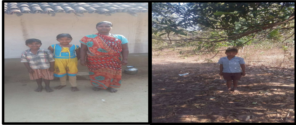
(राज्यस्तरावर जालना येथे बालरक्षक प्रशिक्षण घेऊन शाळाबाह्य विद्यार्थ्यांना शाळेत दाखल केले)