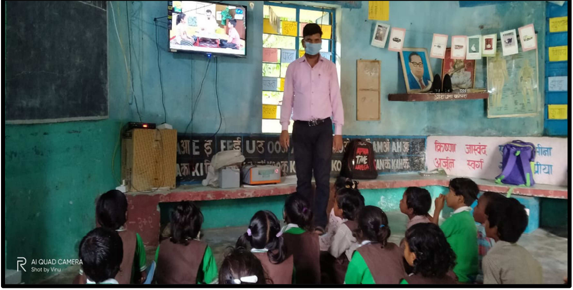
( टिलीमिली कार्यक्रम बघताना शाळेतील विद्यार्थी )