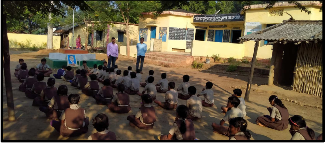
(थोर नेत्यांच्या जयंत्या, बालसभेचे आयोजन)

2) अध्ययन-अध्यापन प्रक्रियेत बदल :- या शाळेत सुरुवातीला विद्यार्थी संख्या फारच कमी होते, विद्यार्थी संख्या वाढण्यासाठी या शाळेतील शिक्षकांनी अध्ययन-अध्यापन प्रक्रियेत रंजकता आणून विविध व नवनवीन अध्यापन पद्धतीचा वापर करून विद्यार्थ्यांना अध्यापन करण्यास सुरुवात केली व पालकांच्या शिक्षणामुळे त्यांचा सहभाग वाढला.