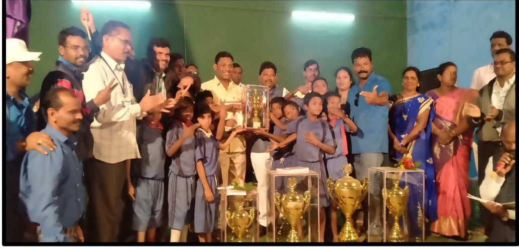
( जिल्हास्तरीय क्रीडा स्पर्धेत चषक स्वीकारताना जाजावंडी शाळेतील विद्यार्थी )

5) जिल्हा, विभाग, राज्य, राष्ट्रीय स्तरावर यशस्वीउपक्रम क्रीडा प्रकार कला प्रकार स्पर्धा यात नैपुण्य : जिल्हा परिषद प्राथमिक शाळा जाजावंडी या शाळेतील विद्यार्थी खेळांमध्ये प्रावीण्य मिळवले आहेत सलग पाच वर्षांपासून केंद्रस्तरीय क्रीडासंमेलनांमध्ये चॅम्पियनशिप प्राप्त केले आहे तसेच सलग तीन वर्षांपासून तालुकास्तरीय क्रीडासंमेलनामध्ये चॅम्पियनशिप प्राप्त केले आहे तसेच जिल्हास्तरावर वैयक्तिक खेळामध्ये या शाळेतील विद्यार्थ्यांनी नैपुण्य मिळवले आहे.